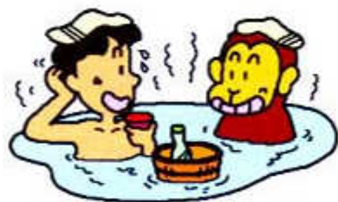
〔ほほえみ読本〕より

い ち ばん 忙 し い 人 間 が い ち ばん 沢 山 の 時 間 を 持 つ